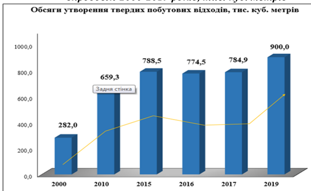
Обсяги утворення твердих побутових відходів в Тернопільській області впродовж 2000-2019 років, тис. куб. метрів