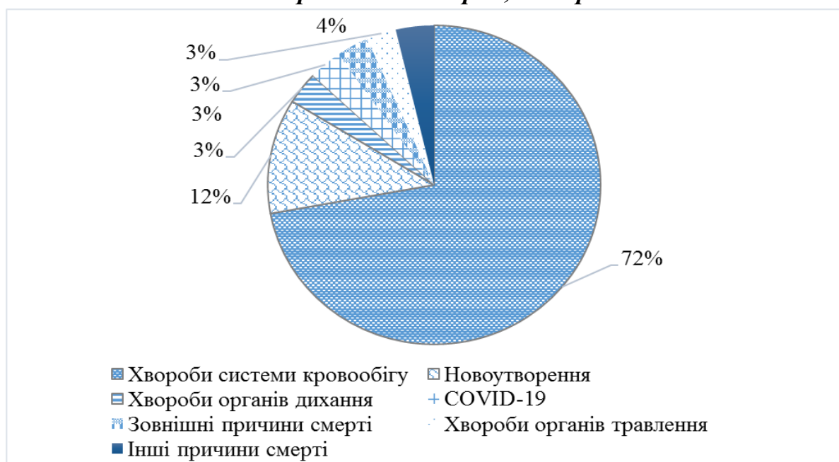
Структура смертності в Тернопільській області за причинами смерті, 2021 рік

При цьому за деякими причинами смертності у Тернопільській області показники перевищують середньоукраїнські, зокрема смертність від хвороб системи кровообігу, новоутворень, хвороб нервової системи, ендокринних хвороб та хвороб органів дихання (рис. 1). Загалом у структурі причин смертності в області переважають хвороби системи кровообігу – 72% та новоутворення – 12%. За останній рік зросла частка хвороби системи кровообігу, що пов'язано із пандемією COVID-19, смертність від якої безпосередньо складає 3% (рис. 4).